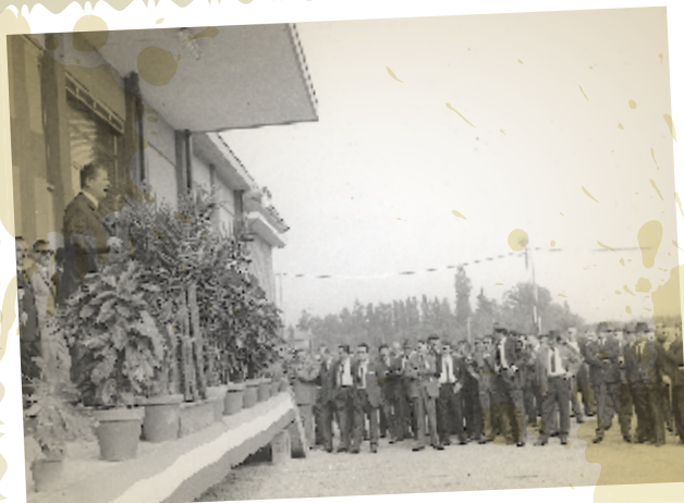
L'inaugurazione del burrificio.