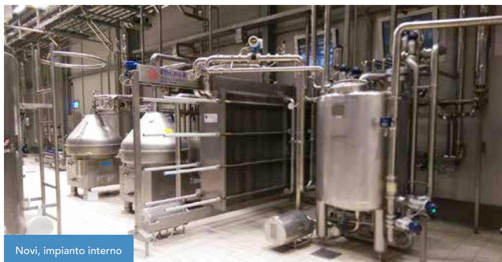
Novi, impianto interno