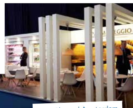
Fiera Plma ad Amsterdam