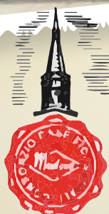
2 ottobre 1966 Inaugurazione sede Via Polonia Burrificio

Era tempo di fare il salto di qualità, di ampliare le proprie aree di intervento e stabilire un rapporto diretto con il mercato. Il CCS si trovava ad un punto cruciale, chiamato a dimostrare la sua capacità di reggere nel mercato, e contemporaneamente a contrastare gli interessi dei grandi agrari, possessori di cantine, frigoriferi e magazzini con cui si controllava la stagionatura. Rispetto ai nuovi ambiziosi programmi la sede di Via Paganine risultava ormai insufficiente, così il 2 ottobre del 1966 il CCS inaugurava la nuova sede di Via Polonia, costruita dalla Cooperativa Muratori di Castelnuovo Rangone. Il nuovo impianto per la lavorazione del burro aveva caratteristiche tali da renderlo il più grande d'Italia; accanto sorgeva un primo, piccolo magazzino per la stagionatura del Parmigiano Reggiano, con una capacità di 17 mila forme. In questo modo iniziavano dunque le attività di stagionatura che con il tempo avrebbero assunto un peso sempre maggiore, mentre la necessità di accrescere il proprio ruolo presso la distribuzione favoriva l'apertura di depositi a Milano, Verona, Genova, Firenze e in altre zone d'Italia, in modo da favorire consegne e approvvigionamenti.