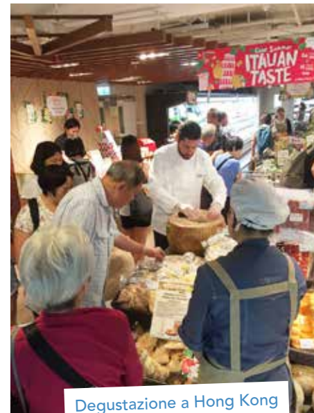
Degustazione a Hong Kong